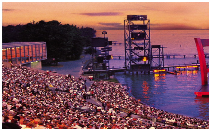
Palcoscenico sul Lago, Bregenz