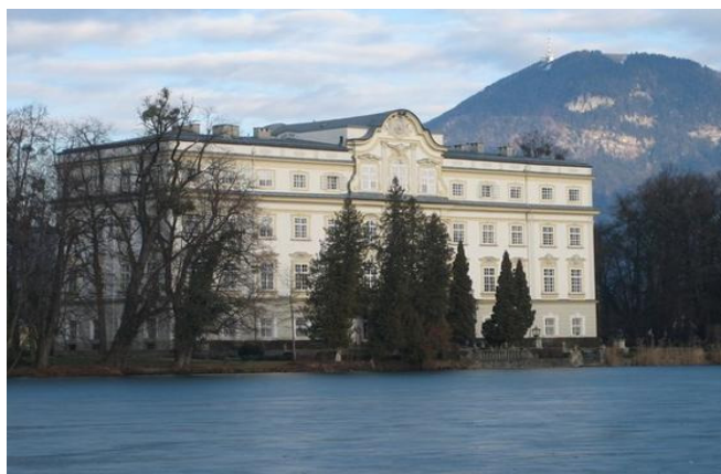
Leopoldskron Schloss, Salisburgo

tel. 0532 201980 (negli stessi orari) - fax: 0532 750488 – e.mail: wanderer.club@libero.it