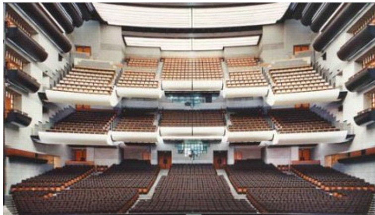
INTERNO DELL' OPÉRA-BASTILLE, PARIS

TEL. 0532 201980 (negli stessi orari) - FAX: 0532 1863134 – E.MAIL: wanderer.club@libero.it