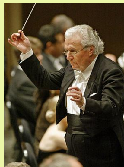
Sir Colin Davis