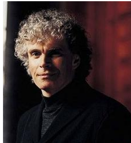
Sir Simon Rattle